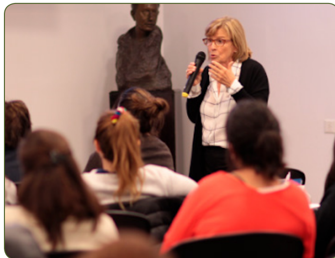
Foto 2 - Simposio ADEEI - CREES sobre "Las tramas de la inclusión: de la Convención (CDPDC) a las experiencias situadas en contextos", el día 5 de octubre de 2019.

Entonces, donde se impulsó muchísimo la creación de los TPP fue en la Provincia de Buenos Aires. Los primeros TPP en la Provincia de Buenos Aires comienzan a aparecer hace cuarenta años aproximadamente y entonces desde el área de Acción Social la Provincia, se incorpora la figura del Programa de TPP del cual soy coautora. Fíjense que en ese momento la temática de inclusión laboral no lo tomaba Ministerio de Trabajo ya que estaba visto desde esa otra mirada mucho más asistencialista.