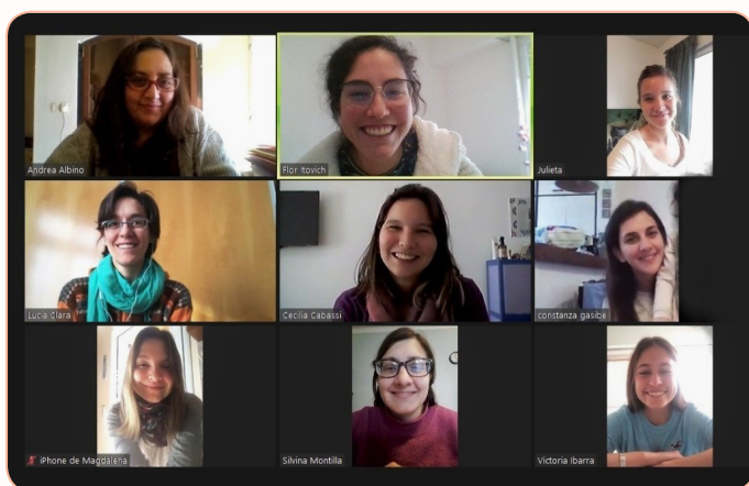
Imagen 2. Encuentros virtuales con autora y autores y edición especial con editoras RATO por el día nacional de la Terapia Ocupacional