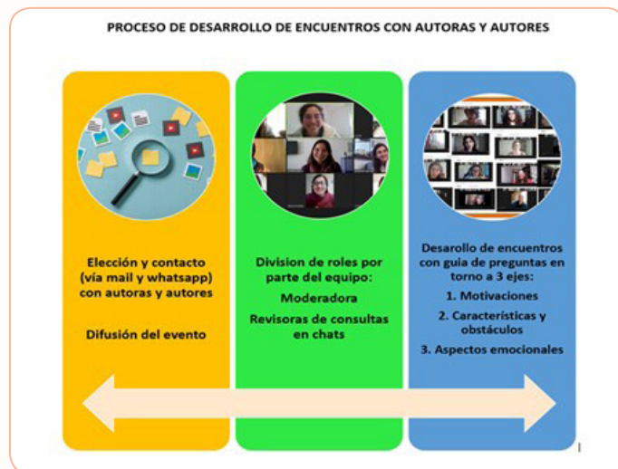
Imagen 3. Proceso de desarrollo de los encuentros

[Recibido: 25/03/21- Aprobado 26/05/2021]